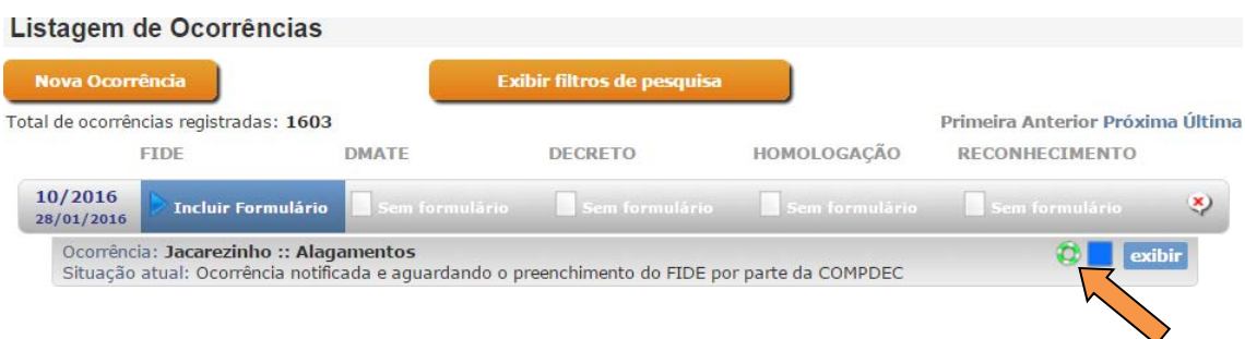
FIGURA 2 – Detalhe do ícone de ajuda humanitária no SISDC.

Após a análise da Coordenadoria Estadual de Proteção e Defesa Civil, o coordenador municipal terá permissão para REALIZAR O PEDIDO VIA SISDC . Todo o processo de solicitação de ajuda humanitária acontecerá totalmente via SISDC. Assim que autorizado, o coordenador municipal receberá um e-mail e aparecerá um ícone em sua ocorrência conforme figura abaixo.