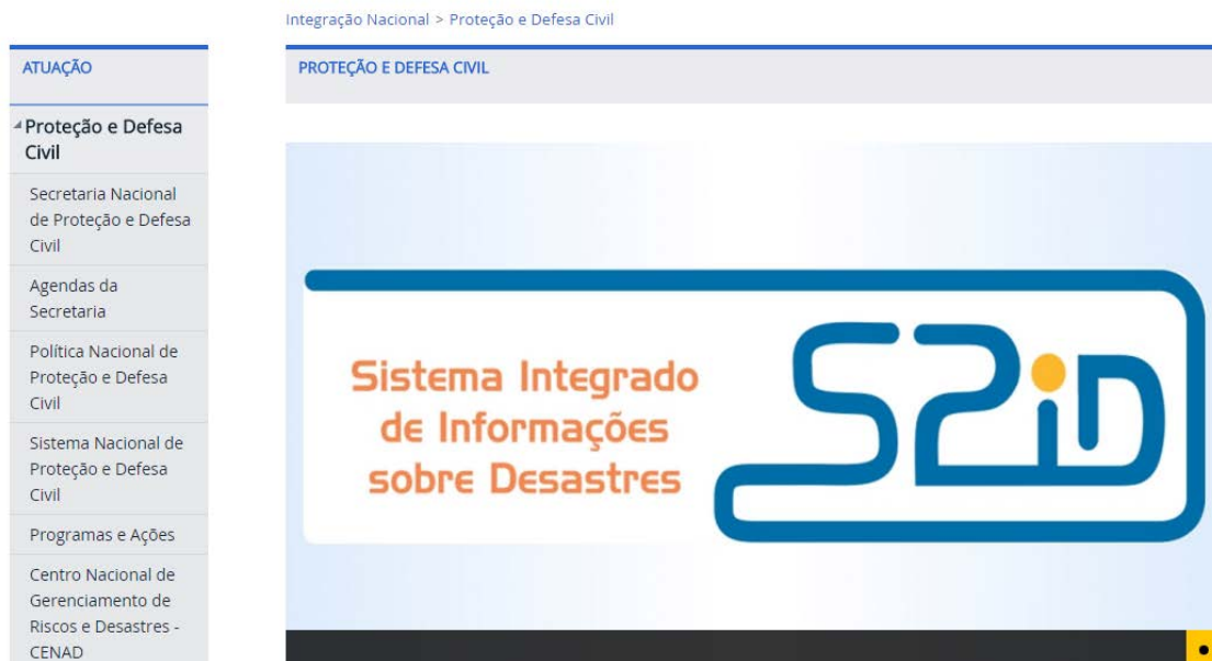
FIGURA 3 – Página inicial do sistema federal – S2ID.

Posteriormente, o coordenador terá a opção de acessar o sistema clicando em MUNICÍPIO/ESTADO .