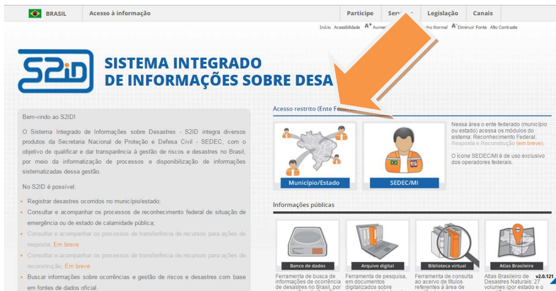
FIGURA 4 – Acesso ao S2ID.

Posteriormente, o coordenador terá a opção de acessar o sistema clicando em MUNICÍPIO/ESTADO .