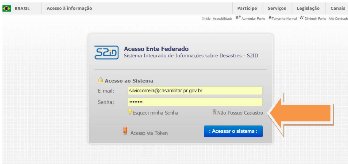
FIGURA 5 – Área de acesso com destaque para o local de cadastramento de novos usuários.