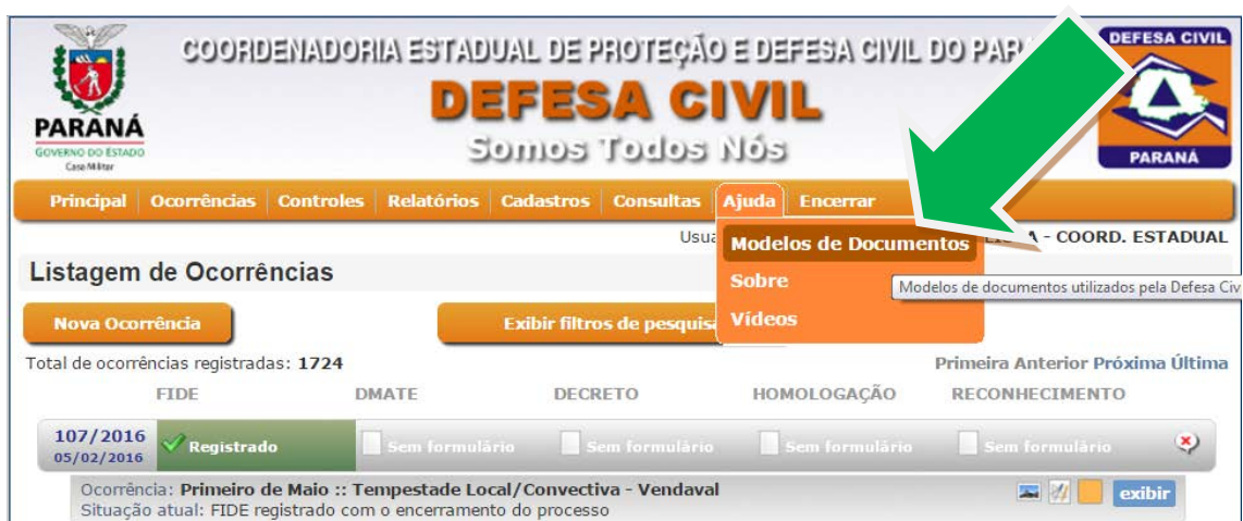
FIGURA 1 – Acesso aos modelos de documentos pelo SISDC.

Avaliação dos Danos: Para que seja possível o preenchimento do formulário, deverá ocorrer uma avaliação completa dos danos e prejuízos ocasionados pelo desastre. O Coordenador Municipal deverá reunir o secretariado municipal e solicitar um laudo comprobatório de todos os danos e prejuízos, de acordo com cada área de atuação. Os modelos de laudos encontram-se disponíveis no SISDC. Assim, cada Secretário deverá prover laudo assinado, em acordo com o modelo, sobre os danos e prejuízos relativos à sua área de atuação no município.